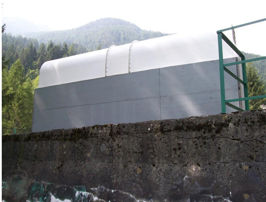
Figura 2: Esempi di realizzazione similari a quella proposta per il ricovero e la protezione dei sistemi.

Il servizio di tipo “Permanent Monitoring in emergenza” (PME) è comprensivo di: