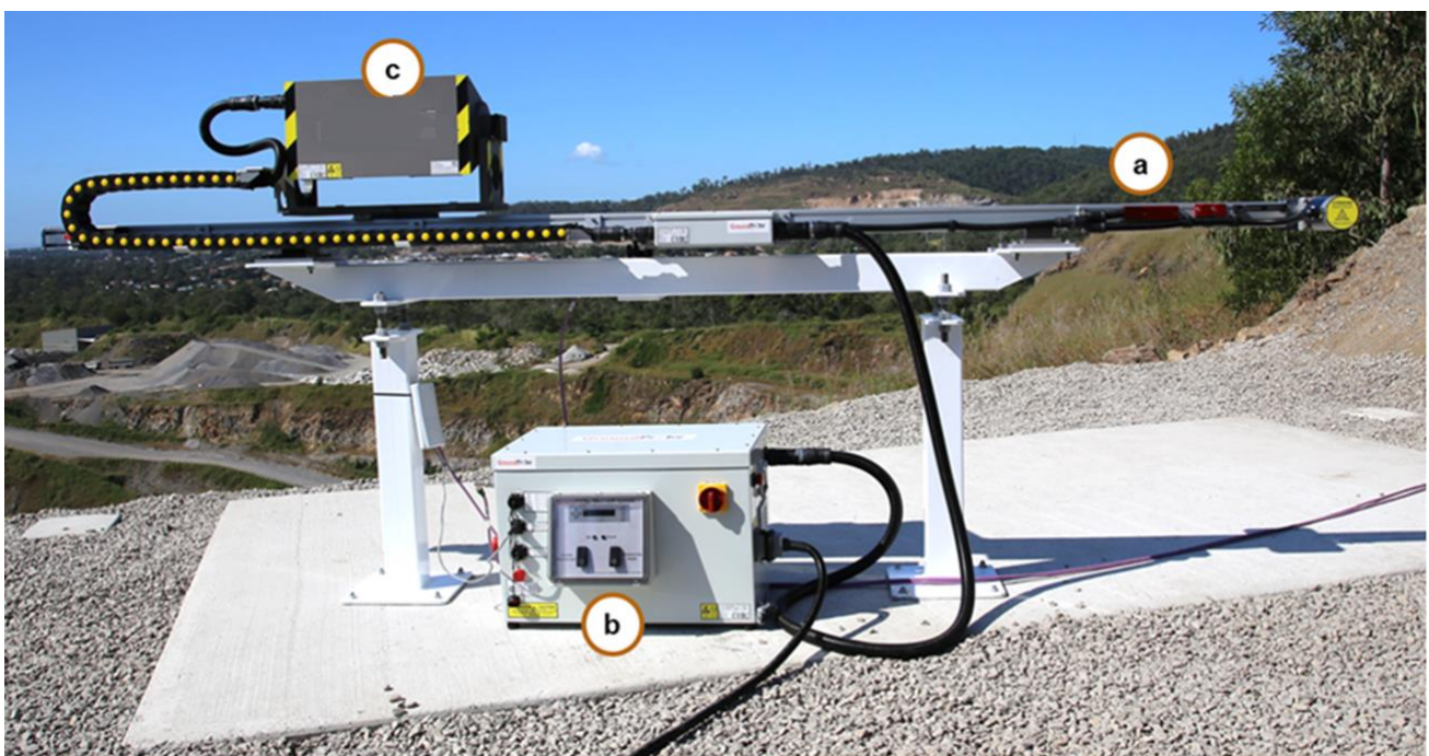
Figura 1: sistema Lisamobile, con indicati i principali componenti: (a) posizionatore lineare, (b) power base e (c) testa di misura.

Il sistema GBInSAR LiSAMobile è un radar ad apertura sintetica (SAR) mobile con piattaforma posizionata a terra, avente capacità interferometriche che è stato espressamente pensato e realizzato per effettuare misure in ambiente esterno per il monitoraggio dei pericoli naturali. e delle deformazioni delle strutture.